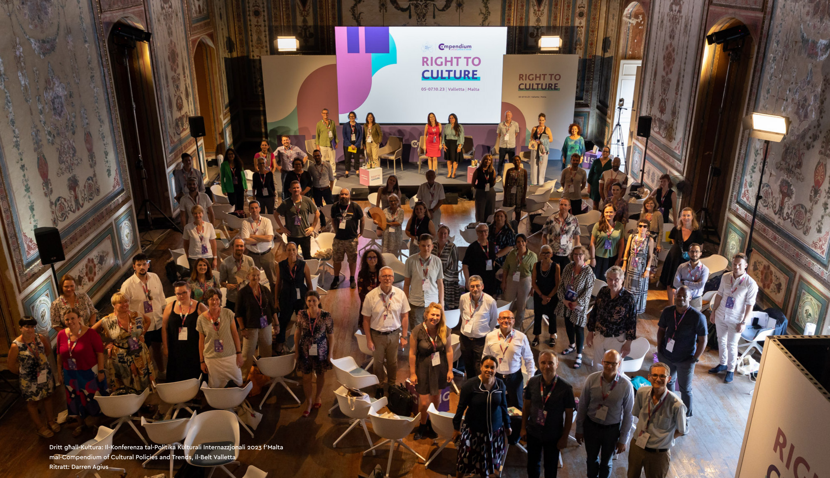
Dritt għall-Kultura: Il-Konferenza tal-Politika Kulturali Internazzjonali 2023 f'Malta maġ-Compendium of Cultural Policies and Trends, il-Belt Valletta